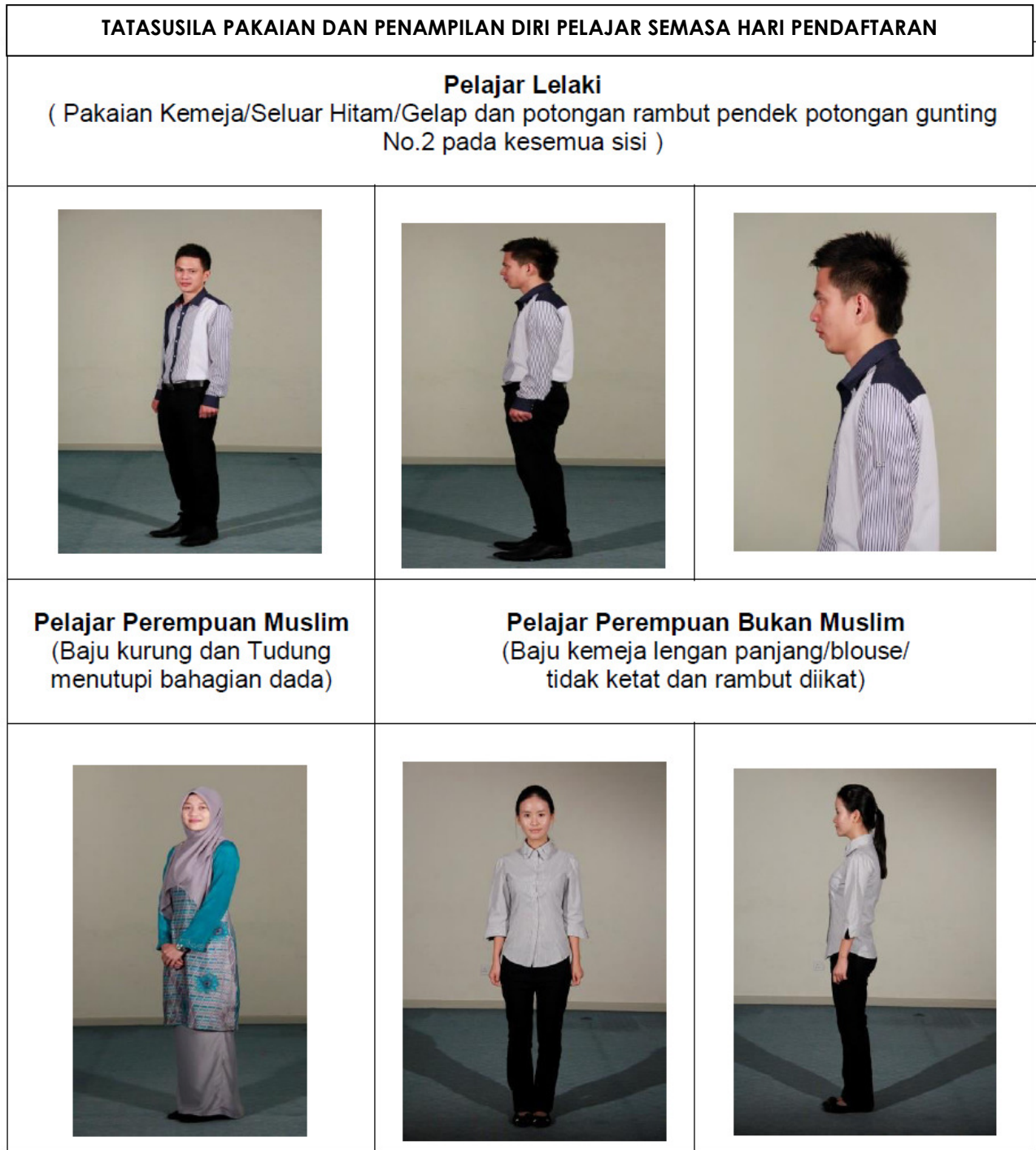
Gambar Rajah 1

CATATAN PENTING : Pelajar yang tidak mematuhi etika pakaian dan kekemasan diri TIDAK AKAN DIBENARKAN untuk mendaftar.